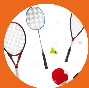
SPORTS DE RAQUETTES